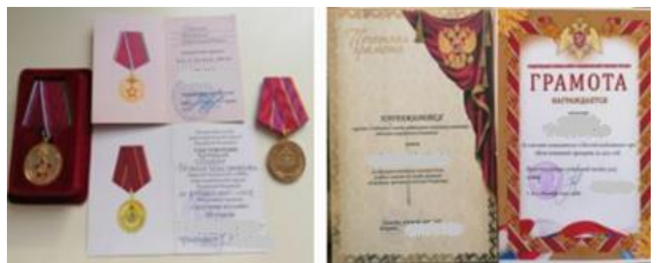
Материал предоставила активист движения первых, ученица 8 «А» класса

Я очень горжусь своим папочкой, он настоящий Герой. Дай Бог, чтобы быстрее закончилась спецоперация, и все вернулись домой живыми и здоровыми! Пусть на всей Земле будет мир!